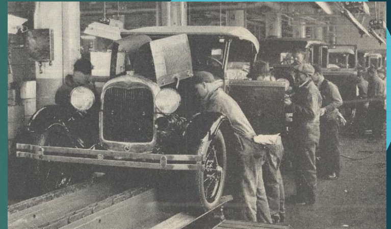
Ford Modelo T (1908 a 1927)